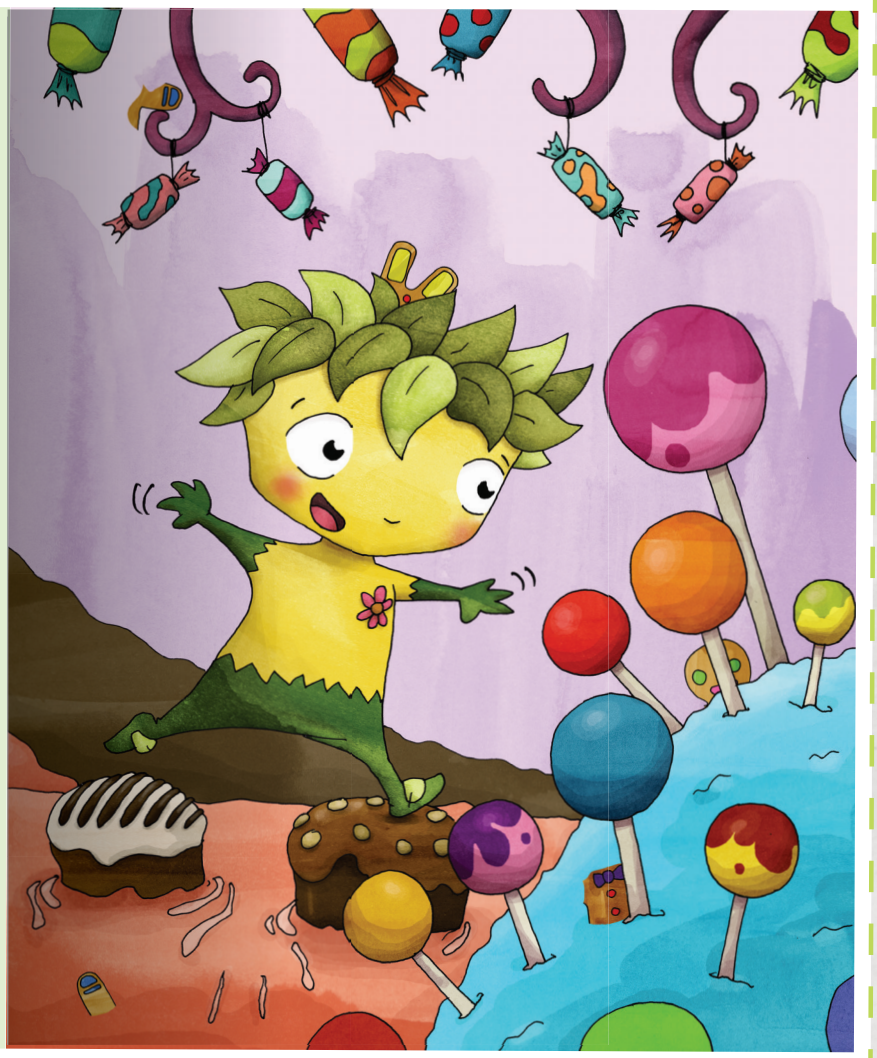
Cucas y el pastelero mágico